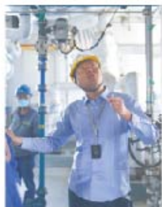
山东药业 王凯 扎实开展车间全员安全管理工作 让事故教训内化于心，让安全意识外化于行 做好指导、监督和考核