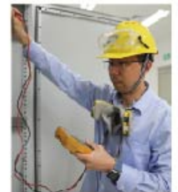
山东氨基酸 赵宁 探究风险管理方法，加强装备稳定运行 共筑工艺本质安全，护航项目安全生产