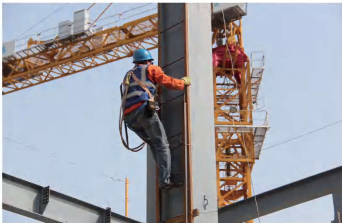
福元医药 段兰怡 摄