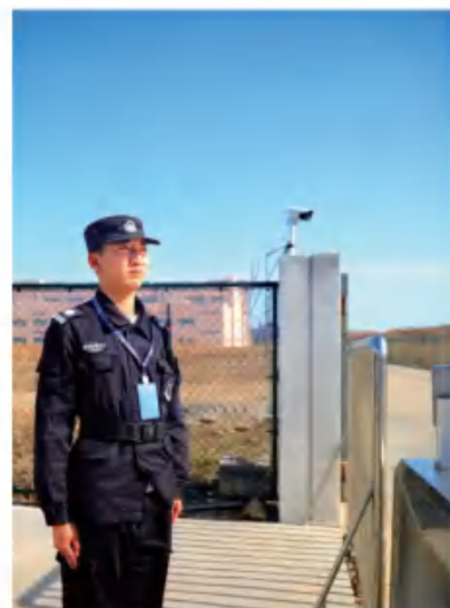
新和成股份黑龙江基地

岁月被奋斗拉长 五月因劳动荣光 这个五月天里 新和成的广大奋斗者 用忠诚与汗水书写责任担当 用微笑和自信面对困难挑战 以开路先锋的昂扬姿态 在平凡的岗位上书写不平凡的业绩 筑就了一道道亮丽的风景线