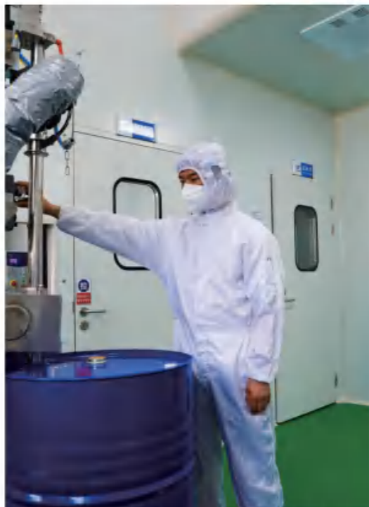
新和成股份山东基地