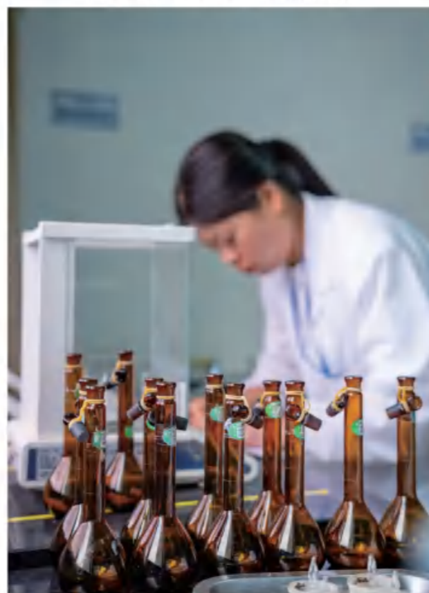
新和成股份新昌基地