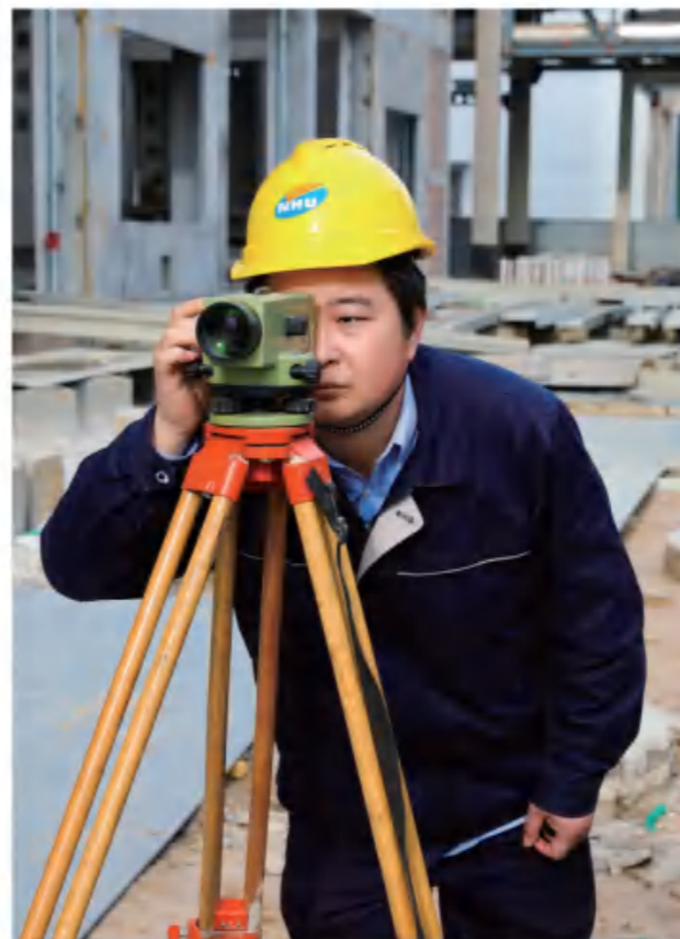
新和成股份山东基地