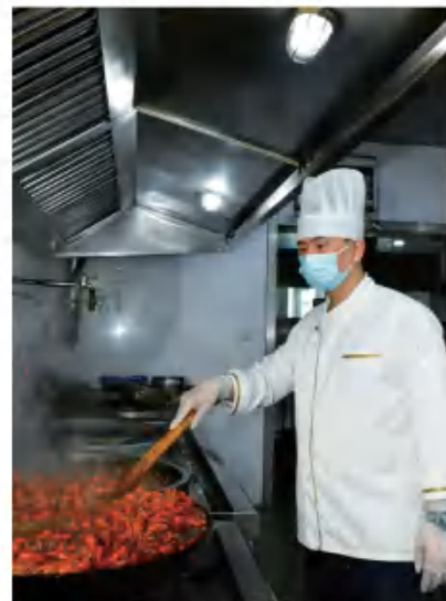
新和成股份股份总部