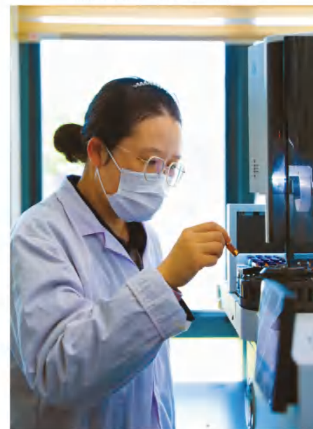
新和成股份山东基地