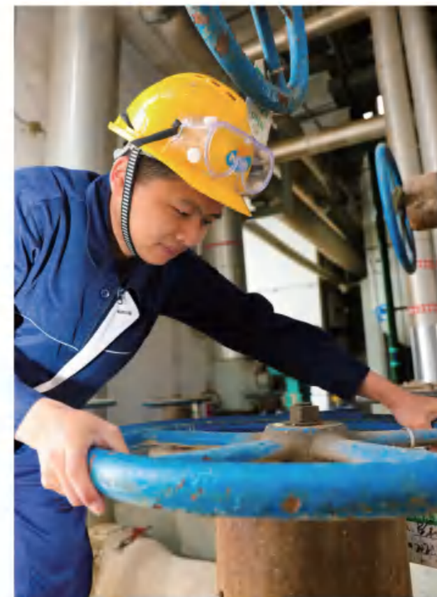
新和成股份上虞基地